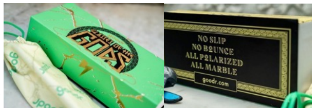
箱とソフトケースも限定モデル！

goodr お得意、旬度を意識しながら周囲と“程よく”差をつけるこなれた着こなしをアシスト。 柄物の服はちょっと抵抗感ある、という人にも最適。